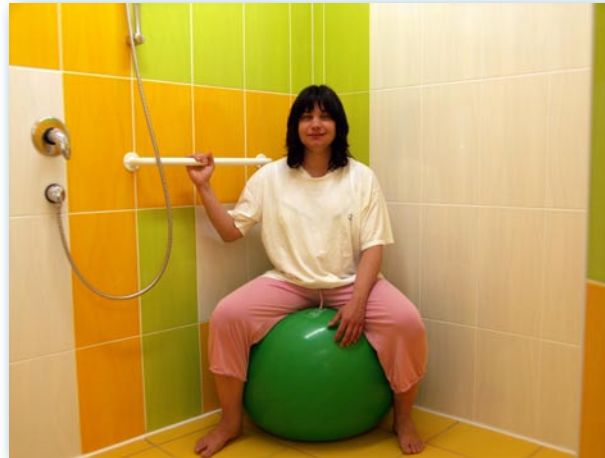
klientka relaxuje na míči v samostatném sprchovém boxu