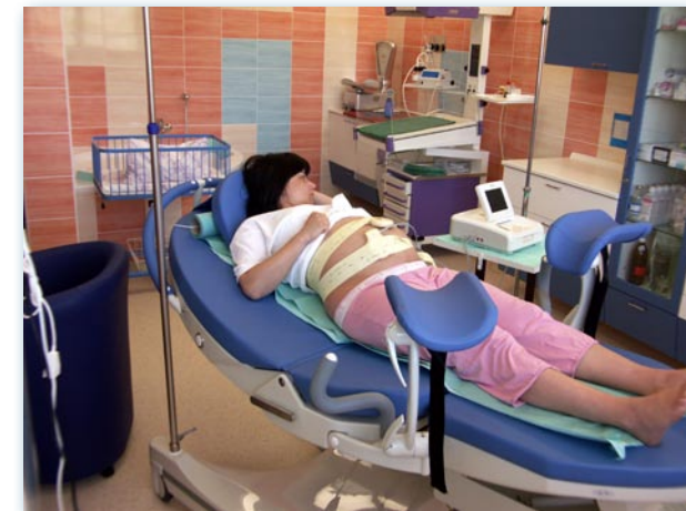
Porodní box modrý melancholický – klientce je prováděno kardiotokegrafické vyšetření, které sleduje děložní činnost a ozvy srdíčka miminka