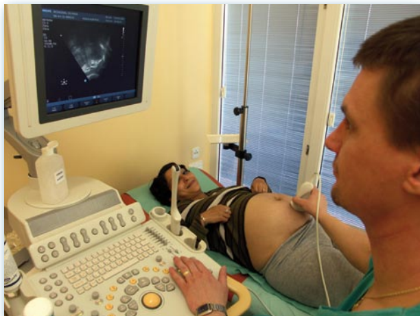
Ultrazuková místnost – lékař s klientkou, provádí tzv. Doppler vyšetření, které ukazuje průtok krve pupečником