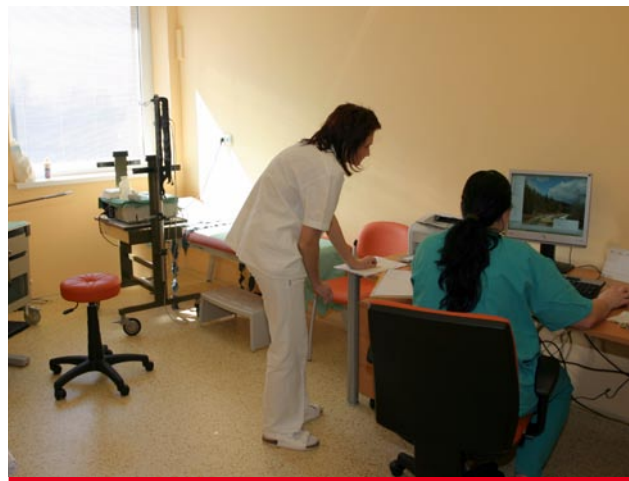
Moderní vyšetřovna s lékařkou a sestrou – zde se provádí vyšetření vaginální a kardiokografické