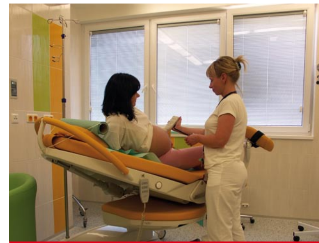
Porodní box žlutý dynamický s klientkou a sestrou, která sleduje ozvy srdíčka miminka