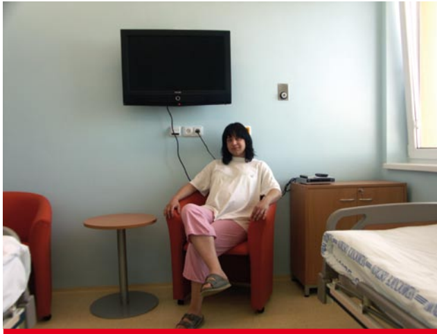
Observační klimatizovaný pokoj modrý s plazmovou televizí a DVD