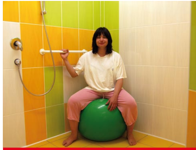
Klientka relaxuje na míči v samostatném sprchovém boxu