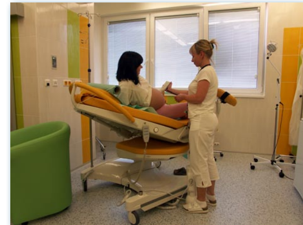
Porodní box žlutý dynamický s klientkou a sestrou, která sleduje ozvy srdíčka miminka