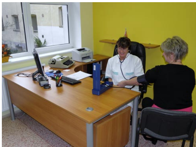
Lékařka s klientkou