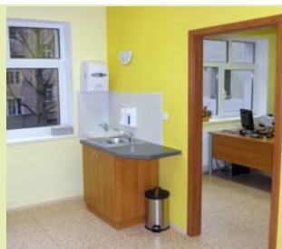
Vstup do ordinace

Ordinace PL pro dospělé v Karlových Varech - Krymská