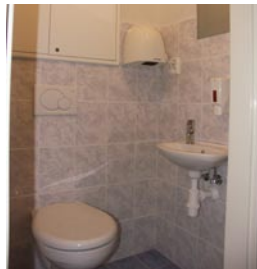
Toalety pro klienty